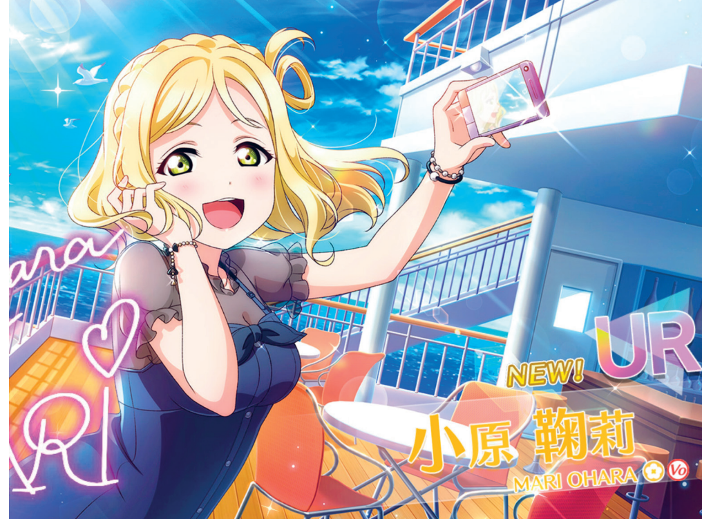
Revelació d'una UR d'Ohara Mari en un scouting del Love Live! School Idol Festival All Stars