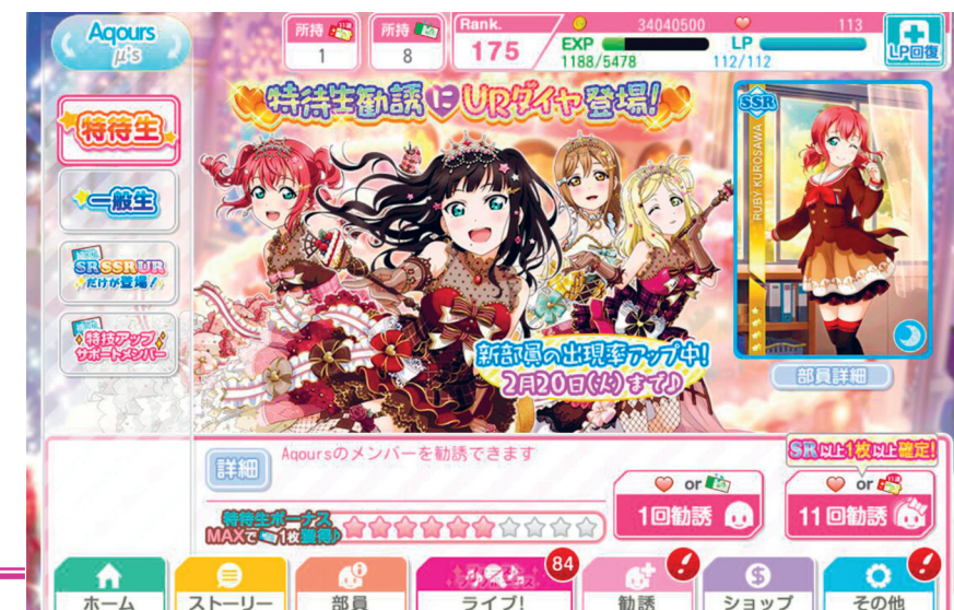
Menú de scouting del Love Live! School Idol Festival. A la secció d'Aqours - honor

Per al mode cooperatiu existeixen diversos tipus d'esdeveniments en el joc, on els jugadors han de competir contra altres jugadors amb la finalitat d'acumular punts d'esdeveniment. Al final d'aquest, depenent de quants punts s'hagin aconseguit, es guanyen certes recompenses.