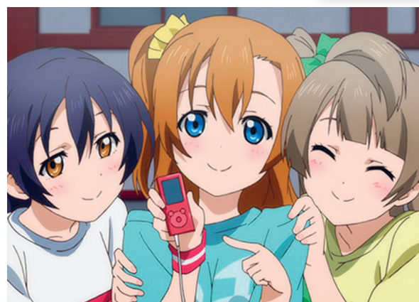
Les membres de segon any en el tercer capítol de la primera temporada de l'animació Love Live! School Idol Project