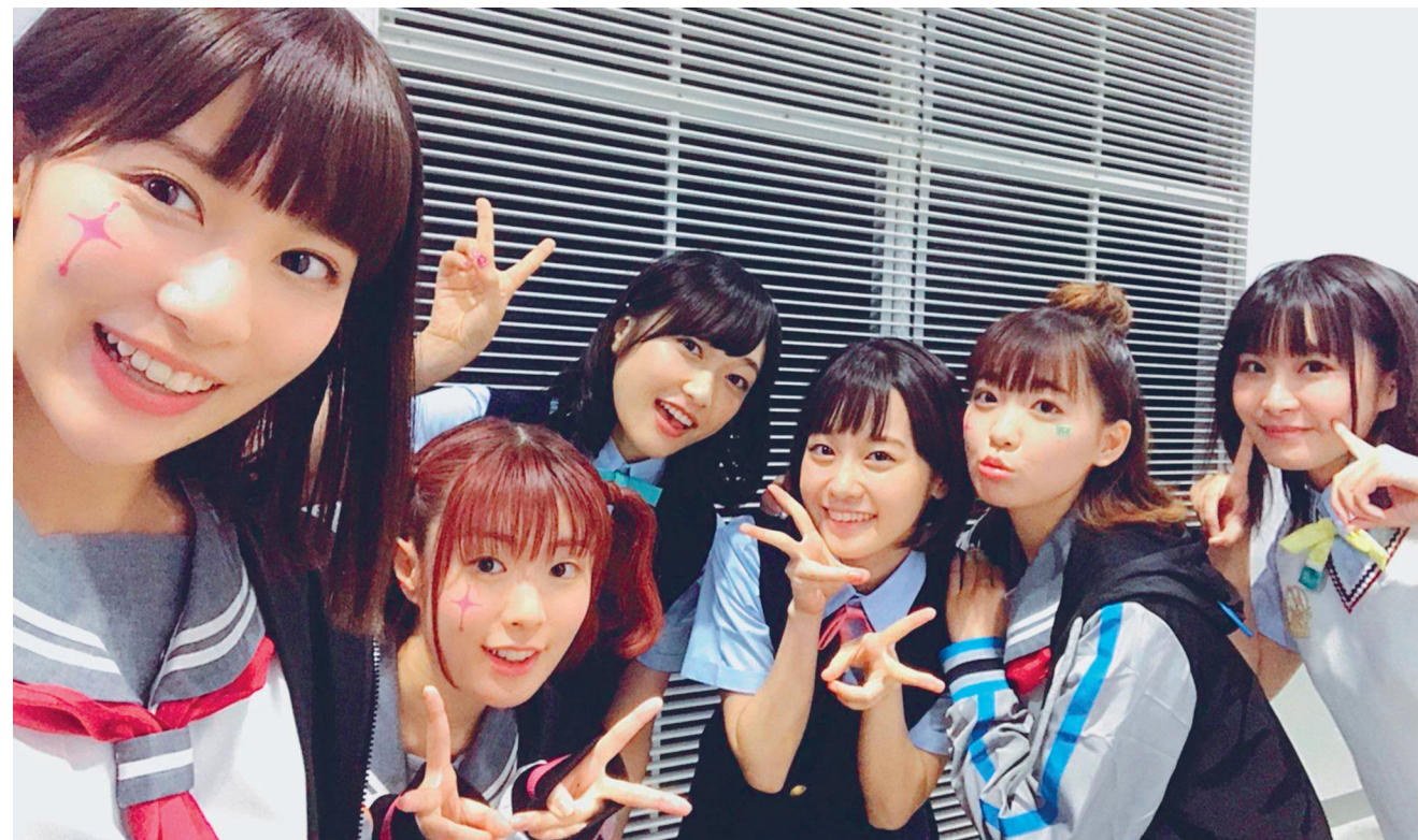
Diferents seiyuus d'Aqours i Nijigasaki després d'un esdeveniment de ràdio informatiu de novetats

Per al nové aniversari de Love Live! es va realitzar un concert amb tots els grups durant els dies 18 i 29 de gener del 2020. Creant així un dels moments més esperats pels fans