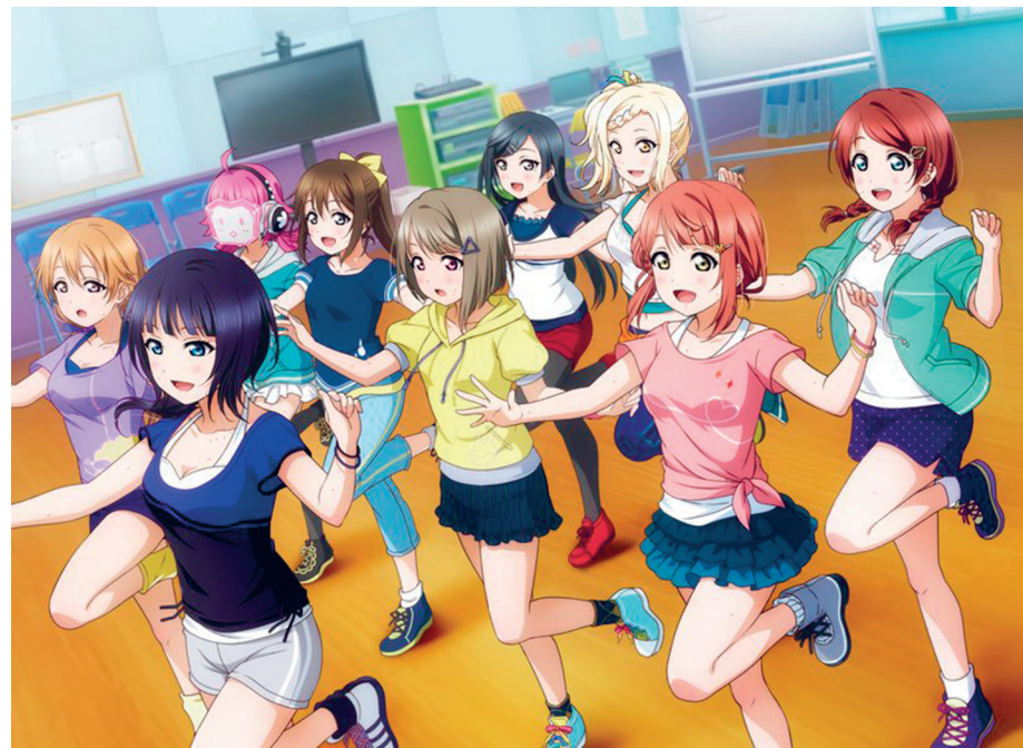
Imatge de les històries de Nijigasaki en el Love Live! School Idol All Stars on surten a la seva sala de club d'ídols

Necessitat que encara que la puguin aconseguir o no, deixarà una connexió important entre les membres.