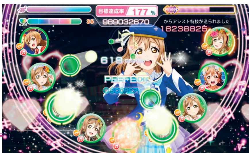
Partida en mode cooperatiu de l'esdeveniment "Rythm carnival" del joc Love Live! School Idol Festival.

Va ser publicat per Bushiroad i KLab el 16 d'abril de 2013 per a iOS, i el 6 de juny de 2013 per a Android. Una versió del joc per a màquines "arcade" va ser anunciada el 27 de novembre de 2015, i està disponible per a jugar des del 6 de desembre de 2016.